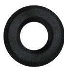
3.201.00 Kleberosette in Schwarzstahl-Optik*